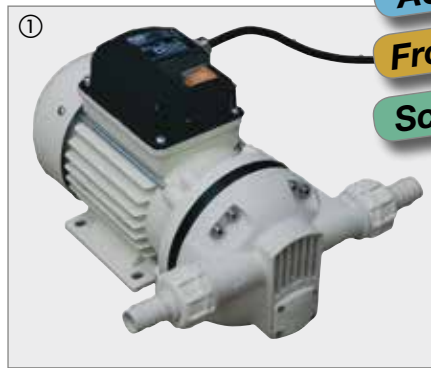
Elektropumpe Cematic Blue 230V

AUS32 (AdBlue®) Frostschutzmittel Scheibenreiniger