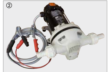
Elektropumpe Cematic Blue 12V + 24V

AUS32 (AdBlue®) Frostschutzmittel Scheibenreiniger